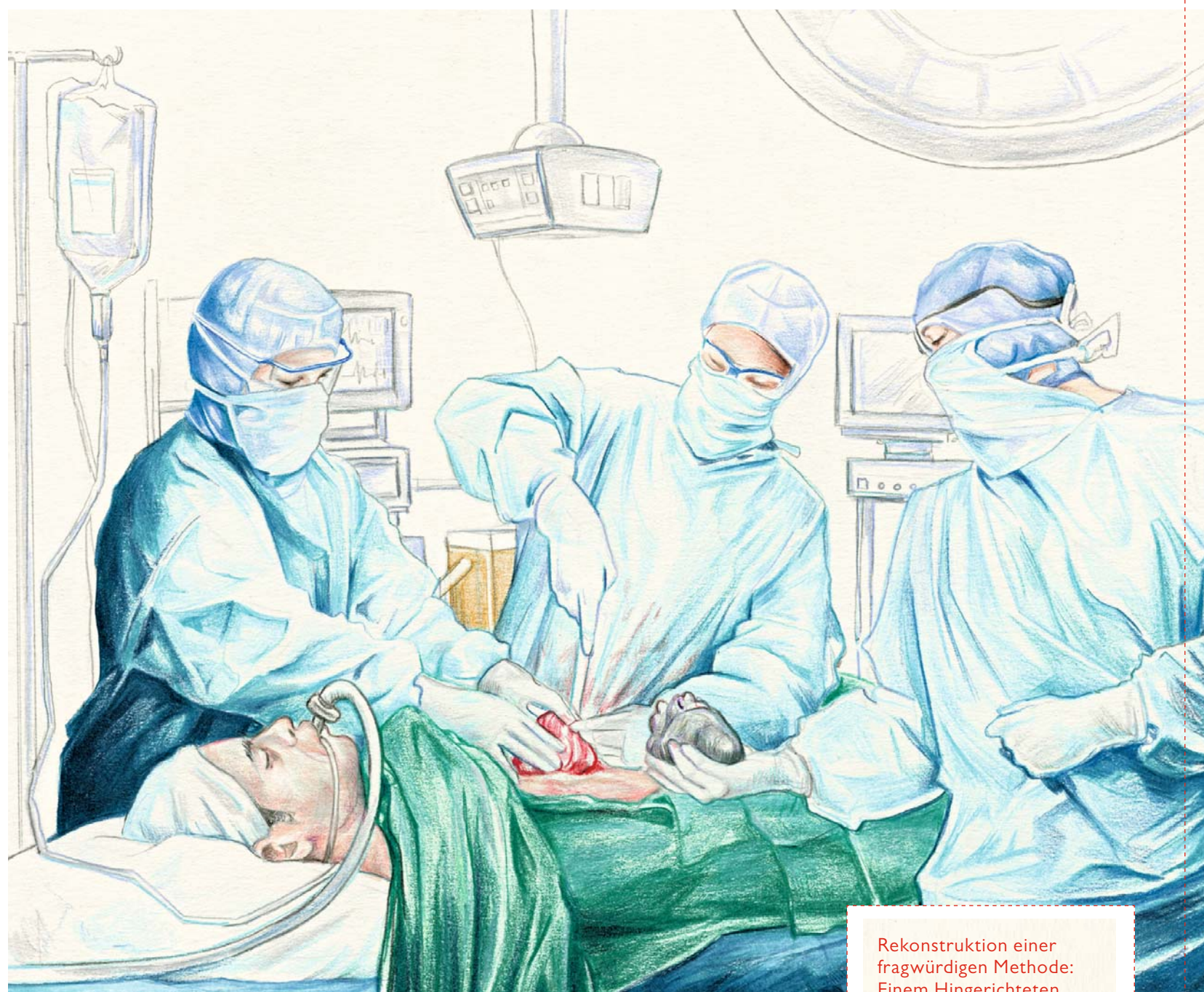
Rekonstruktion einer fragwürdigen Methode: Einem Hingerichteten wird das Herz entnommen (li.), unmittelbar danach wird es einem Patienten implantiert (re.)